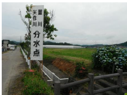
写真 65 No.55 地点 巴川・矢作川豊川分水点 最近の排水路工事分水界が南方 100m に移動していた。 よって 3.5ha 程度矢作川側が増え、豊川側が減った。