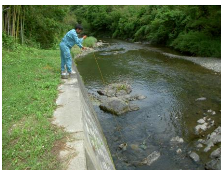
写真 76 No.38 地点 男川中流 夏山川合流点から 100m 下、左岸 下流方向