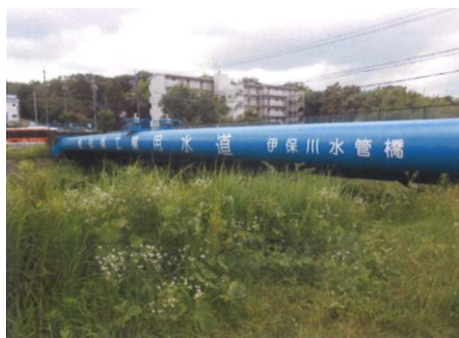
写真 69 No.49 地点 伊保川 向山橋 (下流の左岸から橋方向)