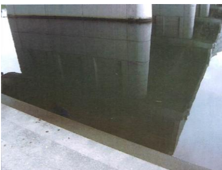
写真 84 No.15 地点 乙川下流 同左、大型のコイ (錦鯉) が多い。