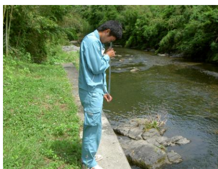
写真 78 No.38 地点 男川中流 同左、透視度測定