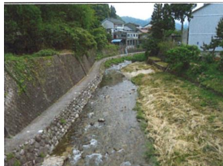
写真 68 No.32 地点 巴川支川・足助川下流 落合橋 (上流側・東方向)