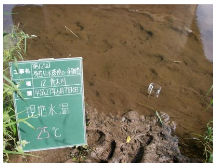
写真 74 No.12 地点 青木川下流 同左、河床 (泥土沈積)