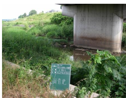
写真 72 No.12 地点 青木川下流 同左、橋梁下