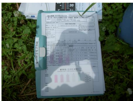
写真 77 No.38 地点 男川中流 水質測定 (COD 2mg/l)