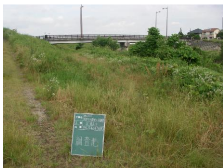
写真 71 No.12 地点 青木川下流 青木橋