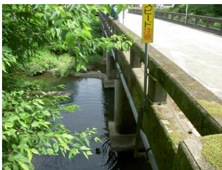
写真 80 No.13 地点 男川下流 同左、採水