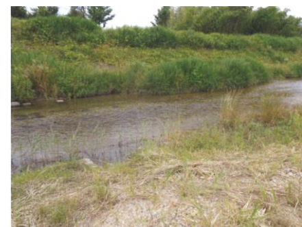
写真 68 No.No.11 地点 籠川下流 同上、左岸堤防側からみた流況