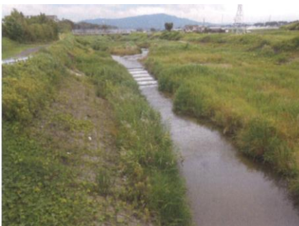
写真 67 No.11 地点 籠川下流 同左、弁天橋から上流側 (北方向) 遠方は猿投山