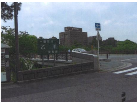
写真 83 No.15 地点 乙川下流 明代橋 (県道 477 号)