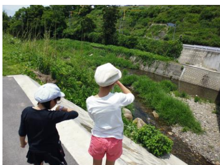
写真 75 No.37 地点 男川上流 豊橋 (片寄の落差工の下流) 下流方向