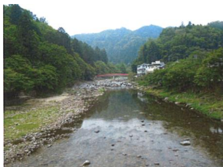
写真 65 No.9 地点 巴川上流 巴橋（上流側・南方向）