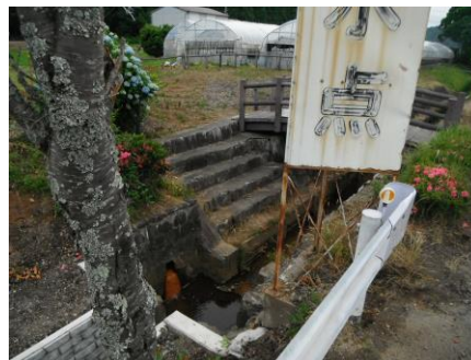
写真 66 No.55 地点 巴川・矢作川豊川分水点 ＜中間湿原（現水田）の平地分水界＞ 暗渠排水口（水底に酸化鉄沈着）で採水