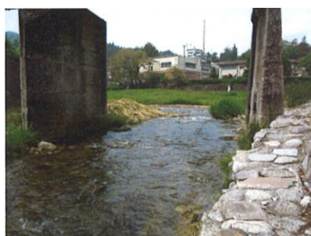
写真 63 No.32 地点 巴川支川・足助川下流 落合橋 (下流側・西方向、巴川合流点)