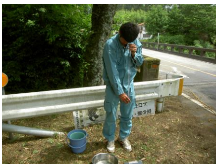
写真 82 No.13 地点 男川下流 同左、透視度測定