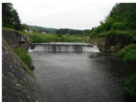
写真 69 No.54 地点 巴川最上流 三河湖上流、菅沼川合流点下（上流方向）