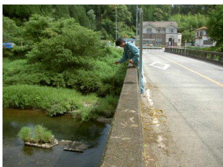
写真 79 No.13 地点 男川下流 学校橋