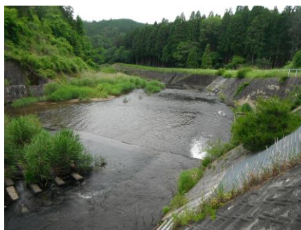
写真 70 No.54 地点 巴川最上流 三河湖上流、菅沼川合流点下（下流方向）