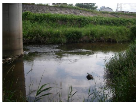
写真 73 No.12 地点 青木川下流 青木橋下の流況