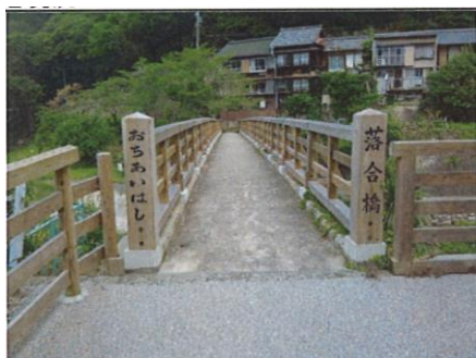
写真 67 No.32 地点 巴川支川・足助川下流 落合橋