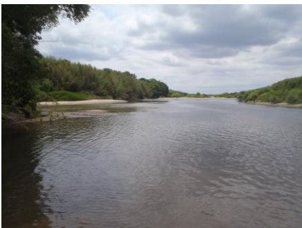
写真 65 No.33 地点 郡界川下流 郡界橋