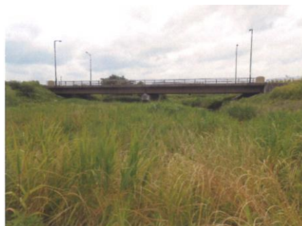
写真 66 No.11 地点 籠川下流 籠川橋の上流にある弁天橋