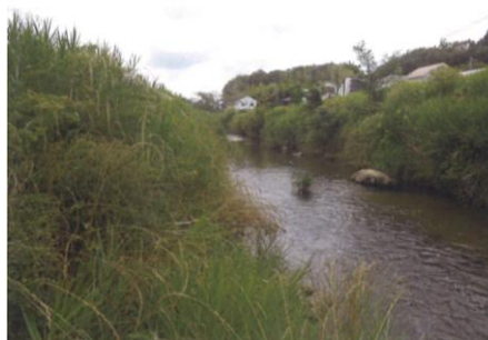
写真 70 No.49 地点 伊保川 向山橋下の流況