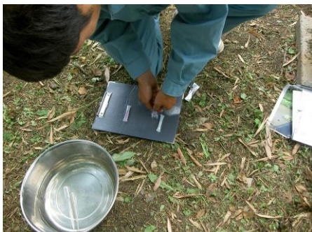
写真 81 No.13 地点 男川下流 同上、水質測定 (パケットテスト) (COD 2~4mg/l)