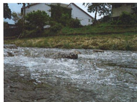
写真 64 No.32 地点 巴川支川・足助川下流 同上 (橋下)、早瀬