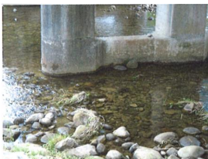
写真 66 No.32 地点 巴川上流 同左、橋脚付近河床