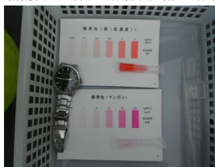
写真 68 No.55 地点 巴川・矢作川豊川分水点 測定値：鉄 2 mg/l、マンガン 2 mg/l