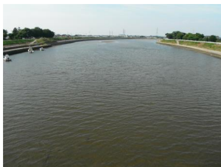
写真 57 No.20 地点、矢作古川下流 松大橋中央から上流・北方向