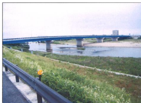
写真 47 No.36 地点 矢作川中流 矢作橋（左岸堤防上から橋・西方向）