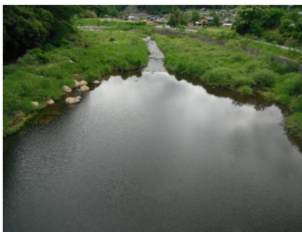
写真 38 No.47 地点 矢作川上流 奥矢作橋 (下流側)