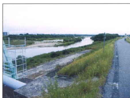
写真 46 No.7 地点 矢作川中流 日名橋下流左岸側（岡崎市日名水源）