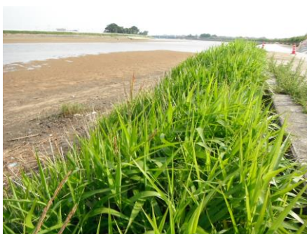
写真 55 No.20 地点 矢作古川下流 写真 52 手前: 潮上帯のアイアシ群落 (イネ科)