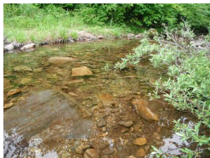
写真 61 No.43 地点 段戸川上流 同上、河床