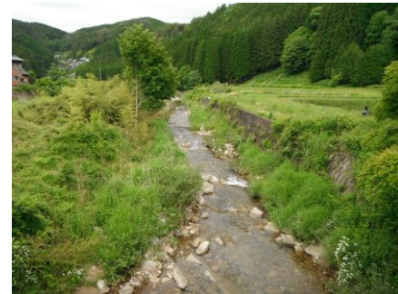
写真 64 No.31 地点 段戸川流 同左、下流方向