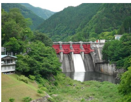
写真 35 矢作第二ダム (遠景)