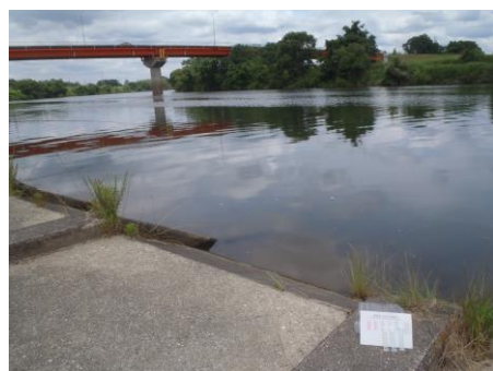
写真 45 No.7 地点 矢作川中流 竜宮橋（下の右岸から上流方向）