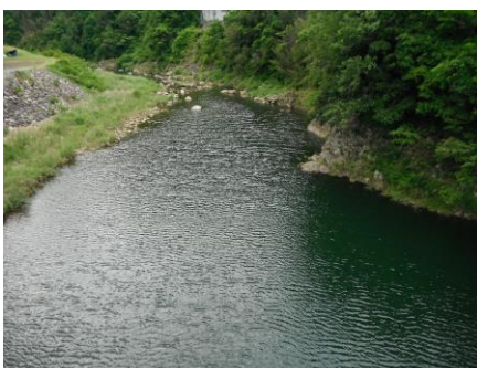
写真 37 No.47 地点 矢作川上流 奥矢作橋 (上流側)