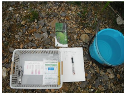
写真 62 No.43 地点 段戸川上流 同左、水質測定