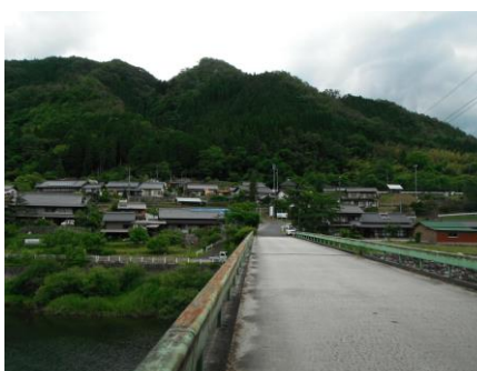
写真 36 No.47 地点 矢作川上流 奥矢作橋 (左岸・愛知県側から右岸・岐阜県側)