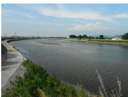
写真 51 No.20 地点 矢作古川下流 松大橋上流 (6/24、下げ潮)