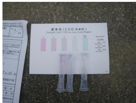
写真 50 No.8 地点 矢作川下流 同左、水質測定