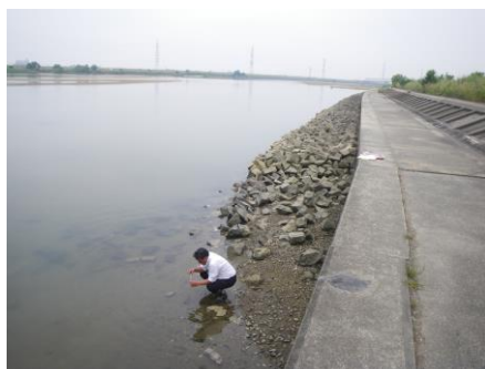
写真 49 No.8 地点 矢作川下流 棚尾橋・左岸 (採水)