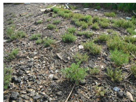
写真 54 No.20 地点 矢作古川下流 同上、満潮線: ハママツナ (アカザ科)