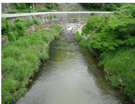
写真 40 No.48 地点 明智川下流 川ヶ渡橋 (上流側)