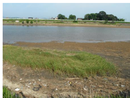
写真 52 No.20 地点 矢作古川下流 同左、河口干潟 (右岸から東の左岸方向) 満潮線: シオクグ群落 (カヤツリグサ科)