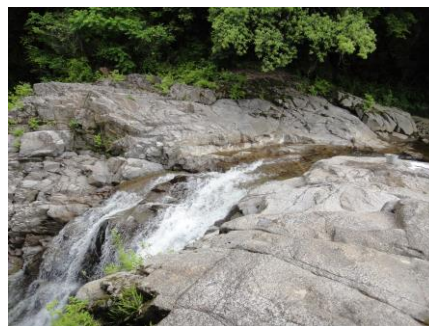
写真 34 No.45 地点 名倉川下流 押山大滝 (岩盤上)