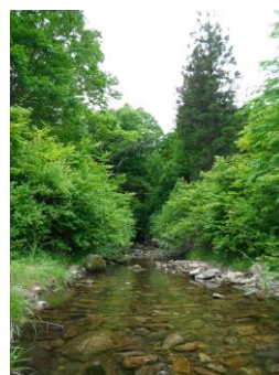
写真 60 No.43 地点 段戸川上流 同左、原生林の出口