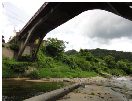
写真 33 No.4 地点 根羽川下流 国界橋