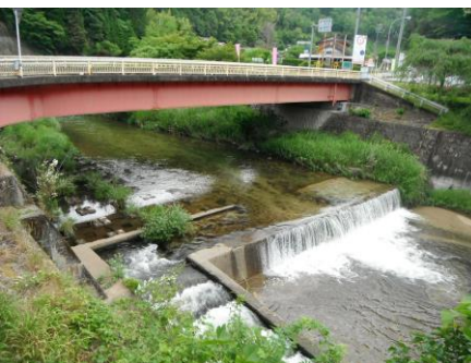
写真 39 No.48 地点 明智川下流 川ヶ渡橋 (右岸から)