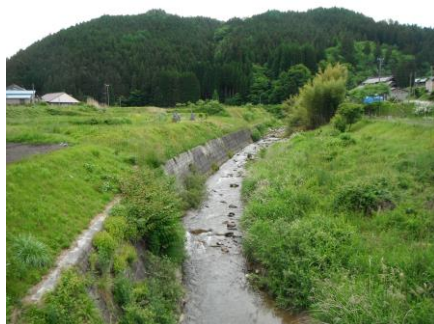
写真 63 写真No.31 地点 段戸川上流 大橋、上流方向