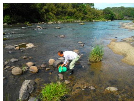
写真 43 No.6 地点 矢作川上流 新富国橋 (撤去された旧橋上流、右岸側)