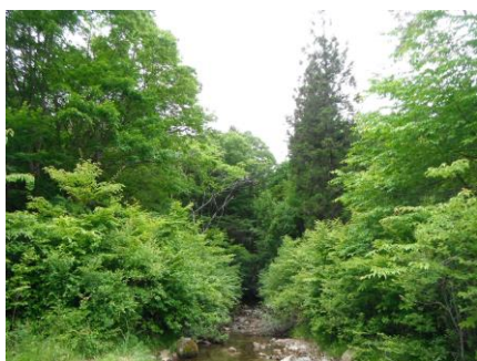
写真 59 No.43 地点 段戸川上流 段戸裏谷原生林、東流する中央の沢