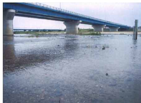
写真 48 No.36 地点 矢作川中流 同左