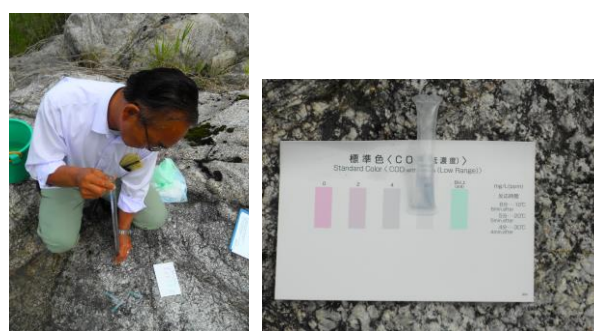
写真 44 No.6 地点 矢作川上流 同左、水質測定