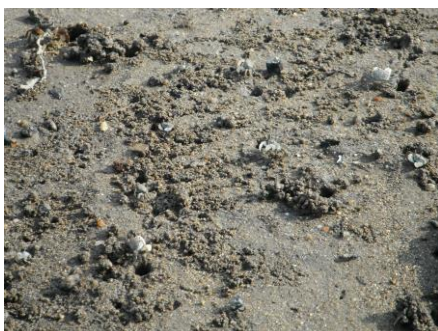
写真 53 No.20 地点 矢作古川下流 同右上、干し出し部のチゴガニ (スナガニ科)