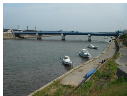
写真 56 No.20 地点 矢作古川下流 松大橋全景 (上流・右岸側から)