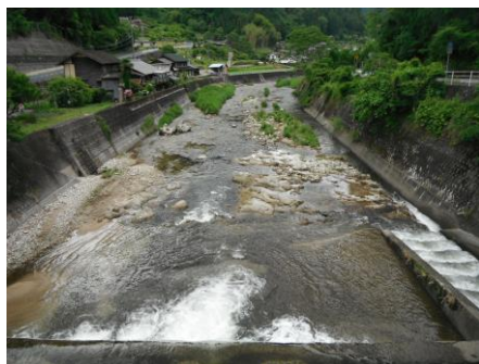
写真 41 No.48 地点 明智川下流 川ヶ渡橋（下流側）