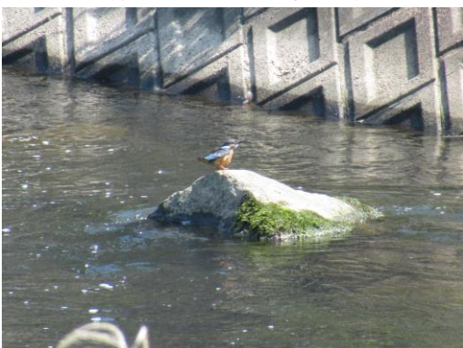
写真 51 No.54 地点 巴川上流 (菅沼川合流下) (カワセミ、6/25)