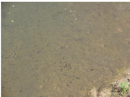
写真 63 No.61 地点 加茂川、加茂川水門 (同上、オイカワ小群、6/25)