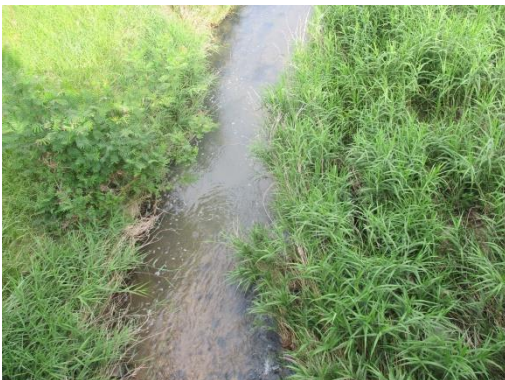
写真 43 No.60 地点 御船川、宮下橋（直下、6/3）