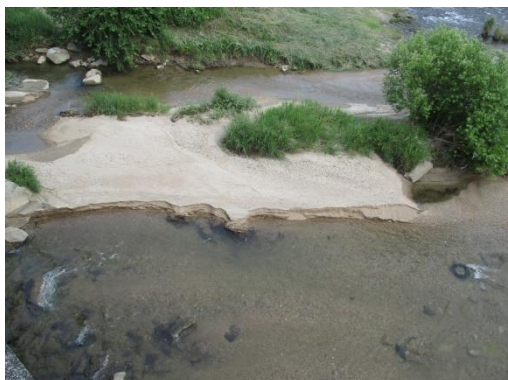
写真 33 No.58 地点、犬伏川 犬伏橋 (直下、6/3)