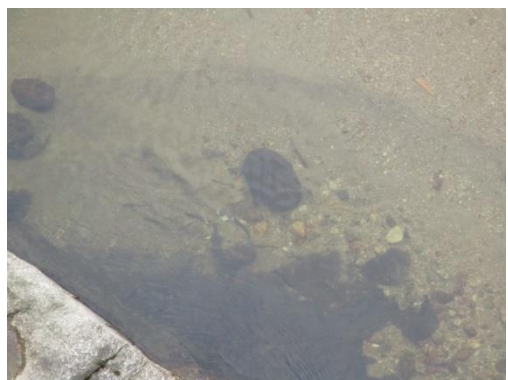
写真 39 No.59 地点、飯野川、広瀬橋 (上流方向、6/3) (写真 36 の拡大、アユが生息、6/3)