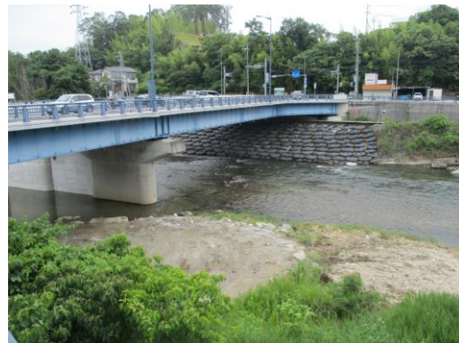
写真 56 No.10 地点、巴川、松平橋 (直下の右岸から、6/8)