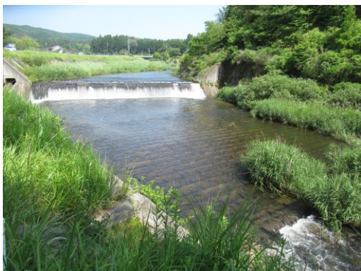
写真 49 No.54 地点 巴川上流 (菅沼川合流下) (右岸から上流方向、6/25)