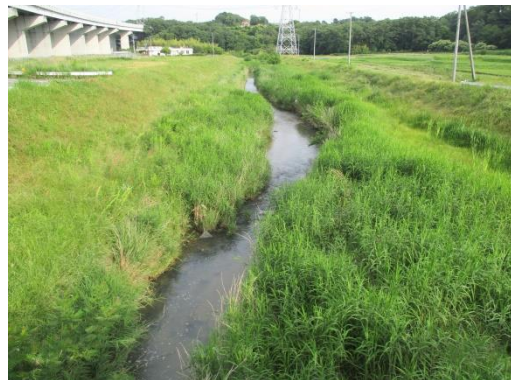
写真 44 No.60 地点 御船川、宮下橋（下流方向、6/3）