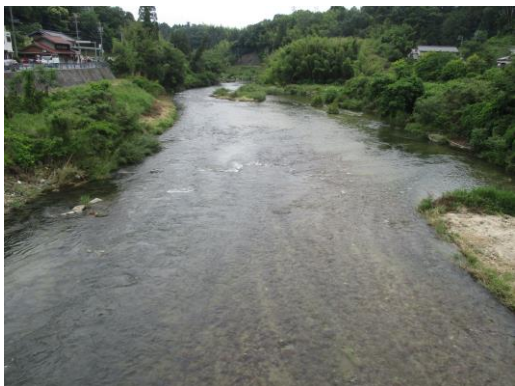
写真 57 No.10 地点 巴川、松平橋 (橋中央から下流方向、6/8)