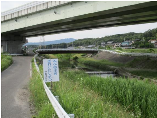
写真 41 No.60 地点 御船川、宮下橋（上流方向、「みふね川をきれいにしよう」御船自治区の表示板、6/3）