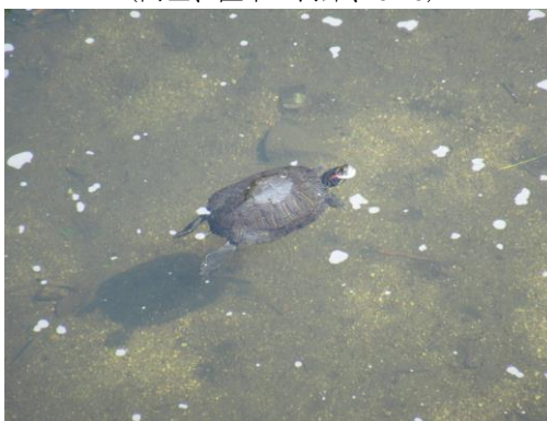
写真 62 No.61 地点 加茂川 (同左、ミシシippiaカミ ミガメ、周囲の泡は付着藻類光合成の O_2 、6/25)