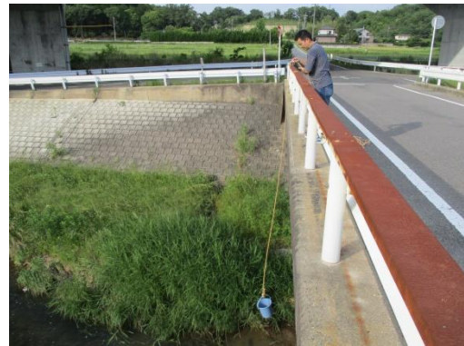
写真 42 No.60 地点 御船川、宮下橋（採水、6/3）