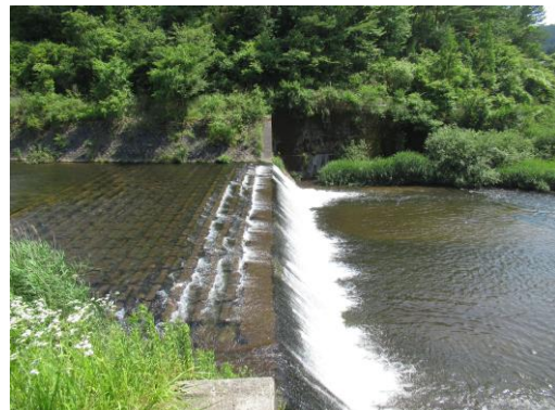
写真 48 No.54 地点 巴川上流、菅沼川合流下（三河湖上流、県道 35 号の二つの橋西方約 500m、6/25）