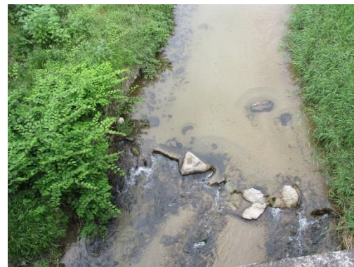
写真 38 No.59 地点 飯野川、広瀬橋 (直上、6/3)