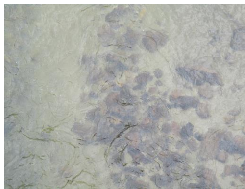
写真 58 No.54 地点 巴川、松平橋 (同左、直下の河床、アユ生息、6/8)