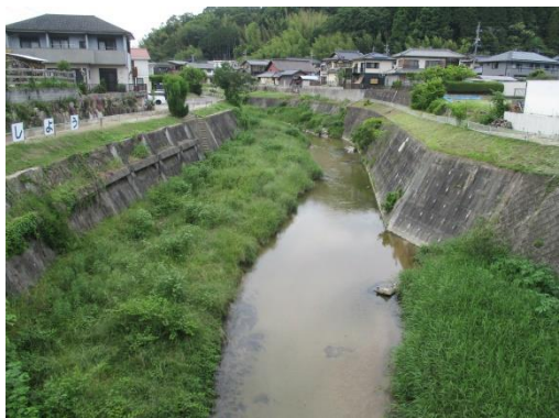
写真 37 No.59 地点、飯野川、広瀬橋 (上流方向、6/3)