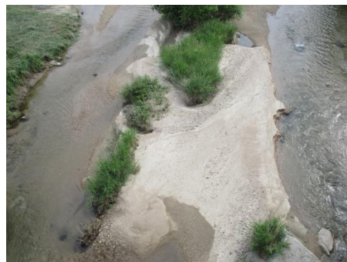
写真 34 No.58 地点、犬伏川 犬伏橋 (直下、6/3)