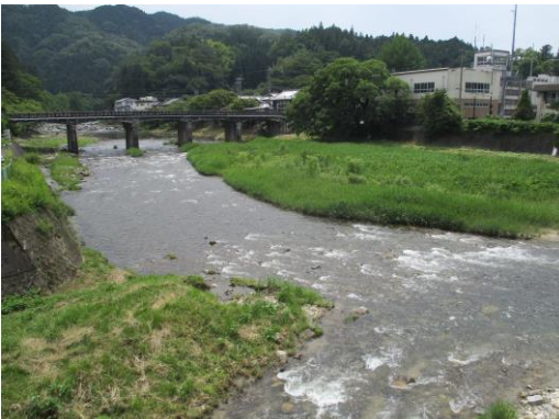
写真 55 No.No.32 地点 足助川 落合橋 (巴川流入点、上流のNo.9 地点方向、6/8)