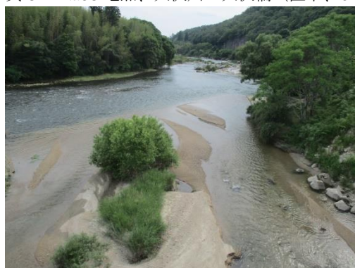
写真 36 No.58 地点、犬伏川 犬伏橋 (矢作川流入下流方向、6/3)