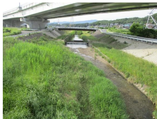
写真 40 No.60 地点 御船川、宮下橋 (下流方向、上の斜め横断は東海環状自動車道、6/3)