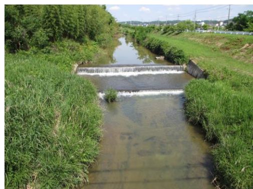
写真 31 No.47 伊保川 向山橋（上流方向、6/2）