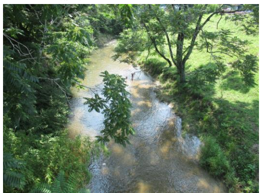
写真 59 No.33 地点 郡界川、郡界橋 (橋中央から下流方向、6/25)