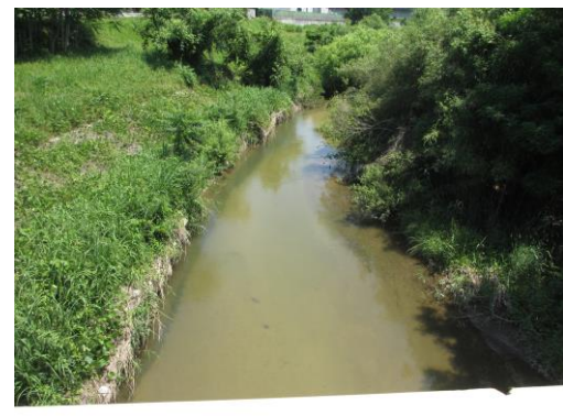
写真 46 No.11 地点 籠川 籠川橋（上流方向、6/2）