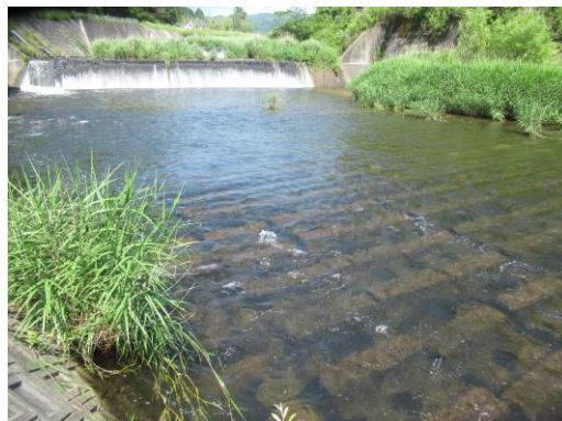
写真 50 No.54 地点 巴川上流 (菅沼川合流下) (同左、河床、6/25)