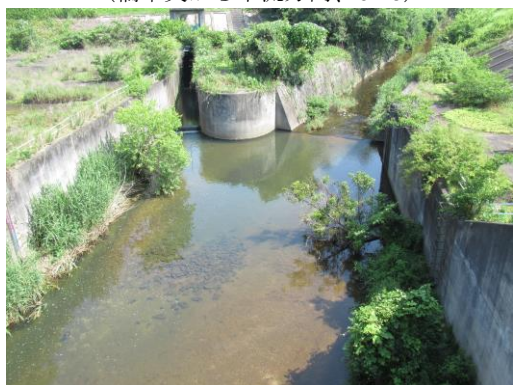
写真 61 No.61 地点 加茂川、加茂川水門 (直上、6/25)