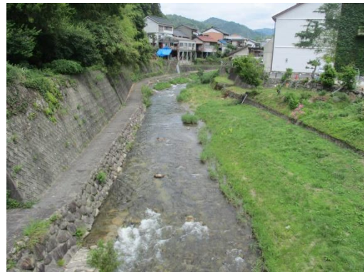
写真 54 No.32 地点 足助川 落合橋 (橋中央から上流方向、6/8)