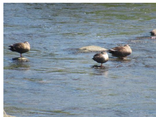
写真 52 No.54 地点 巴川上流 (菅沼川合流下) (カルガモの小群、6/25)