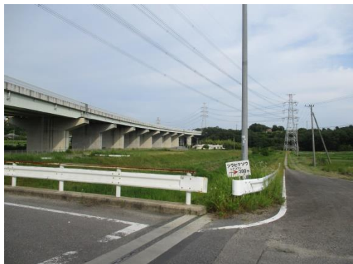
写真 45 No.60 地点 御船川、宮下橋（湿地「シラヒゲソウ、シデコブシ 300m」表示板、6/3）