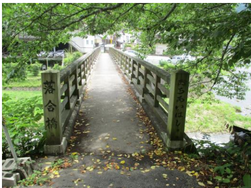
写真 53 No.32 地点 足助川 落合橋 (巴川流入前の小橋、6/8)