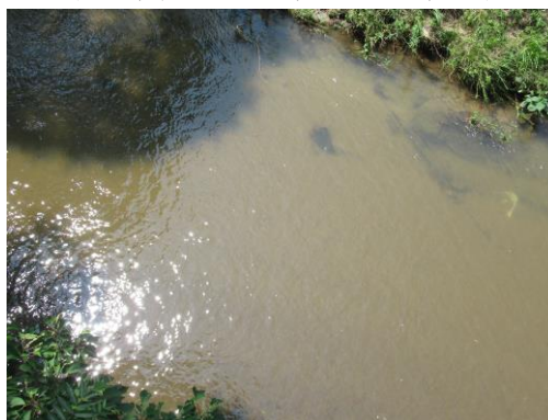
写真 60 No.33 地点 郡界川、郡界橋 (同左、直下の河床、6/25)