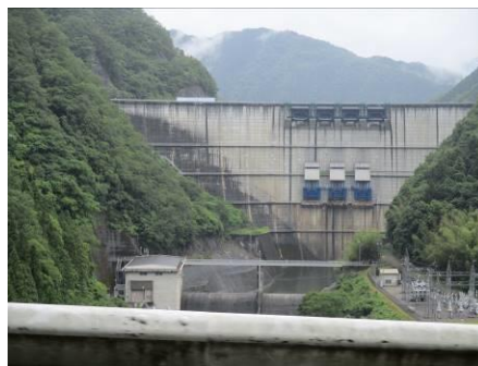
写真 34 矢作ダム