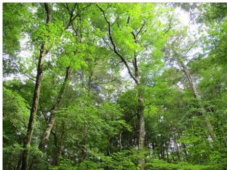
写真 57 No.43 地点 段戸川上流 段戸裏谷原生林 (階層構造 樹冠～低木)