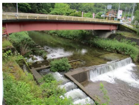
写真 39 No.48 地点 明智川下流 川ヶ渡橋 (右岸から)