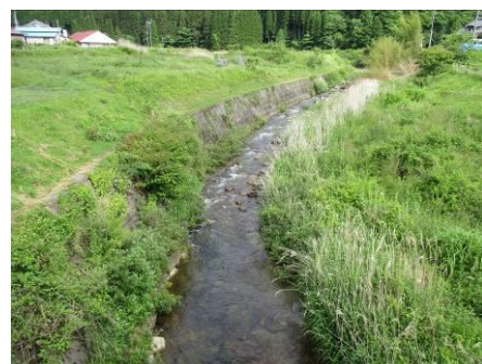
写真 64 No.31 地点 段戸川上流 同左、上流側