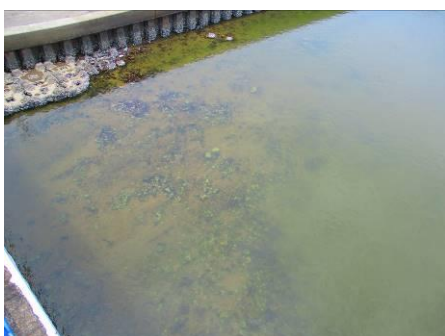
写真 55 No.20 地点 矢作古川下流 同上、橋直上 透明な鹹水と不透明な淡水の境目