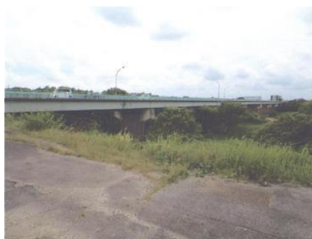
写真 43 No.7 地点 矢作川中流 日名橋、上流側 (6/4 左岸堤防から)