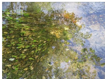
写真 62 同上、下流 (段戸湖流入前) 水草 ヒルムシロ (ヒルムシロ科)