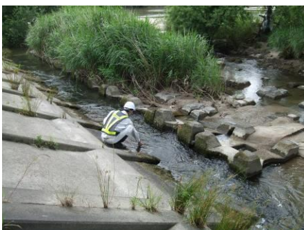
写真 45 No.44 地点 矢作川下流 米津橋・右岸 (6/4 採水)