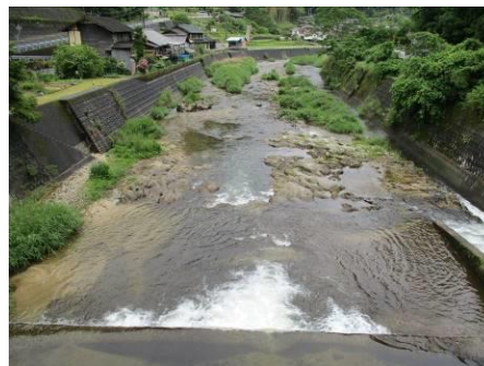
写真 42 No.48 地点 明智川下流 川ヶ渡橋 (下流側)