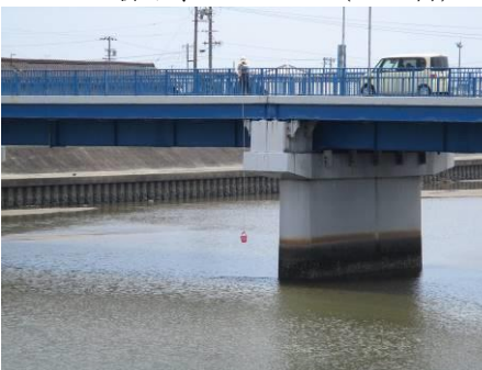
写真 54 No.20 地点 矢作古川下流 松大橋 (6/17 採水)