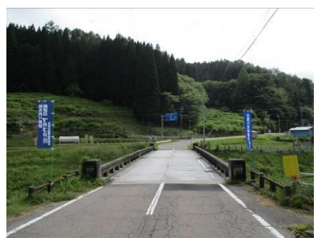
写真 63 写真No.31 地点 段戸川上流 大橋