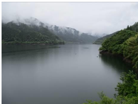
写真 33 奥三河湖