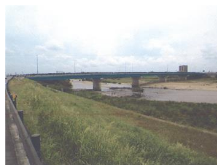
写真 44 No.36 地点 矢作川中流 矢作橋、上流側 (6/4 左岸堤防から)