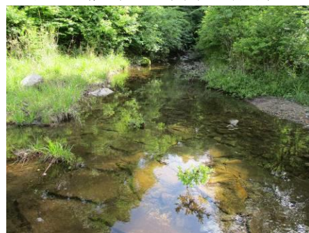
写真 60 No.43 地点 段戸川上流 同左、河床 (測定地点)