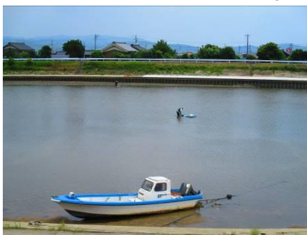
写真 52 No.20 地点 矢作古川下流 松大橋上流側 シジミ採り、カルガモ (カモ科)