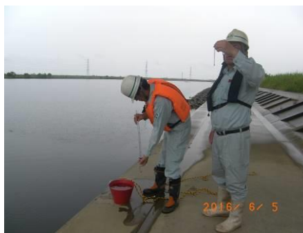
写真 50 No.8 地点 矢作川下流 同左 (透視度 45cm、COD 4mg/l)