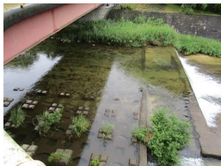
写真 40 No.48 地点 明智川下流 同左 (河床状況は昨年と変わらない。)