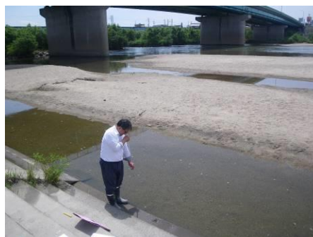
写真 48 No.44 地点 矢作川下流 米津橋・右岸 (6/8 採水) (透視度 28cm、COD 3mg/l)