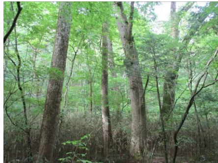
写真 58 No.43 地点 段戸川上流 同左 (巨木・亜高木～林床)