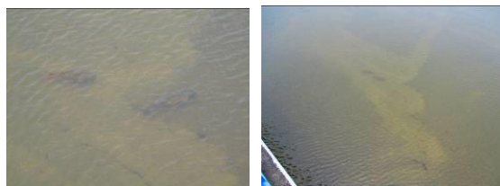
大型のコイ (コイ科) シジミ採りマンガ (鋤簾) の引き痕跡