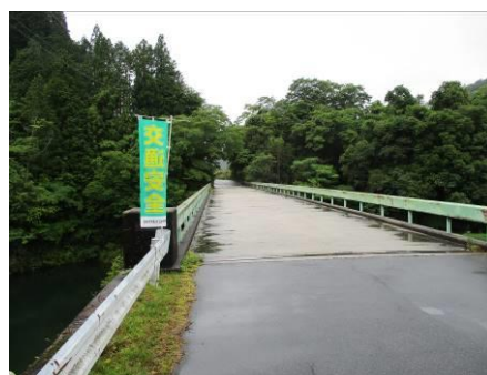
写真 36 No.47 地点 矢作川上流 奥矢作橋 (左岸・愛知県側、右岸・岐阜県側)