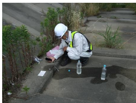
写真 47 No.44 地点 矢作川下流 同上、水質測定 (COD 3mg/l)