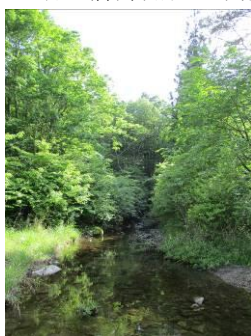
写真 59 No.43 地点 段戸川上流 同上、原生林流域を東流する沢 (林地出口)