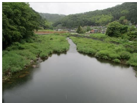
写真 38 No.47 地点 矢作川上流 奥矢作橋 (下流側)