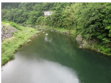
写真 35 No.47 地点 矢作川上流 奥矢作橋 (上流側)