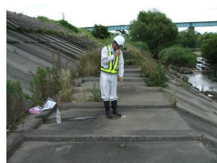
写真 46 No.44 地点 矢作川下流 同左、水質測定 (透視度 55cm)