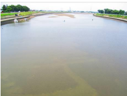
写真 53 No.20 地点 矢作古川下流 松大橋中央から上流方向