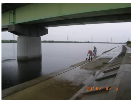
写真 49 No.8 地点 矢作川下流 棚尾橋・左岸 (6/5 水質測定)