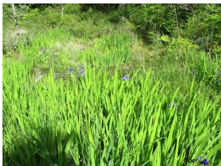
写真 61 同右上、右岸の湿地 (東海自然歩道脇) ノハナショウブ (アヤメ科)