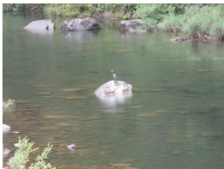
写真 37 No.47 地点 矢作川上流 同上 (拡大)、カワウ (ウ科)