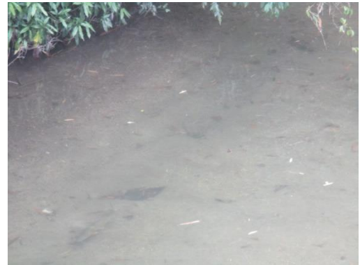
写真 28 No.57 地点 阿摺川 最下流の橋 (右岸寄りの河床、6/3)