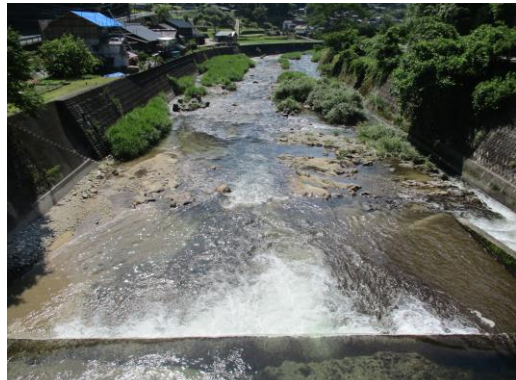
写真16 No.48 地点 明智川 川ヶ渡橋 (橋から下流方向、出前は落差工、6/3)