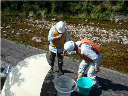
写真9 No.5 地点 根羽川 平瀬橋 (左岸階段護岸、6/2)