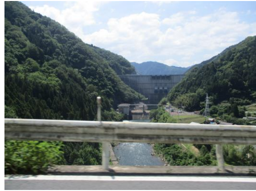
写真10 矢作ダム：アーチ式コンクリートダム (下流側から、6/3)