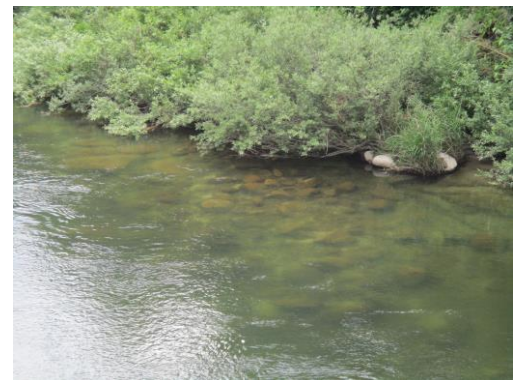
写真 24 No.56 地点 矢作川 岩倉橋 (下流右岸寄り河床、6/3)