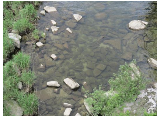
写真 22 No.56 地点 矢作川 岩倉橋 (左岸側の河床、6/3)