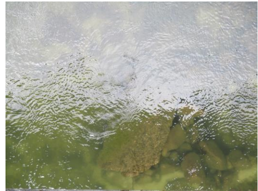
写真 20 No.56 地点 矢作川 岩倉橋 (橋中央下の河床、6/3)