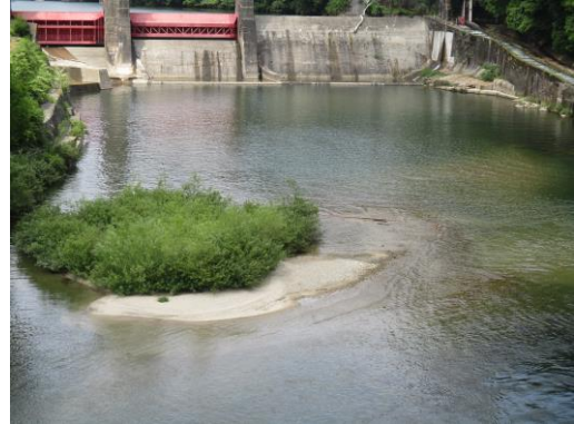
写真 18 No.56 地点 矢作川 岩倉橋 (百月ダム直下の河床、右の左岸は魚道、6/3)