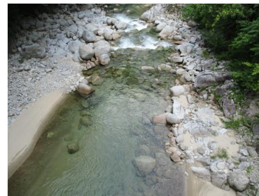
写真 6 No.2 上村川上流 明林橋 (下流方向、6/3)