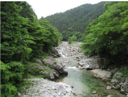
写真 5 No.2 上村川上流 明林橋 (上流方向、6/3)