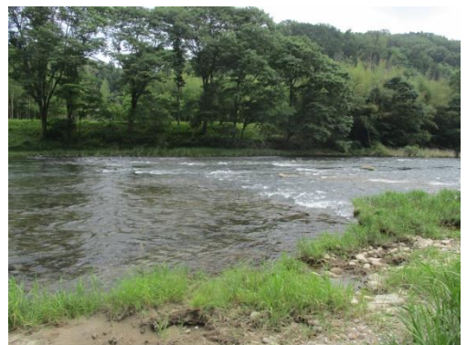
写真 31 No.No.6' 地点 矢作川 ソジバ (右岸から下流方向、6/3)