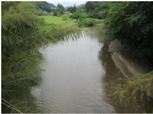
写真 27 No.57 地点 阿摺川 最下流の橋 (橋中央から上流・東方向、6/3)