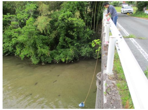
写真 26 No.57 地点 阿摺川 最下流の橋 (矢作川流入点、6/3)