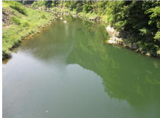
写真12 No.47 地点 矢作川上流 奥矢作橋 (直上、6/3)