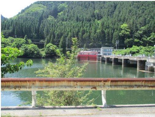
写真11 第二矢作ダム (直上右岸側から、6/3)