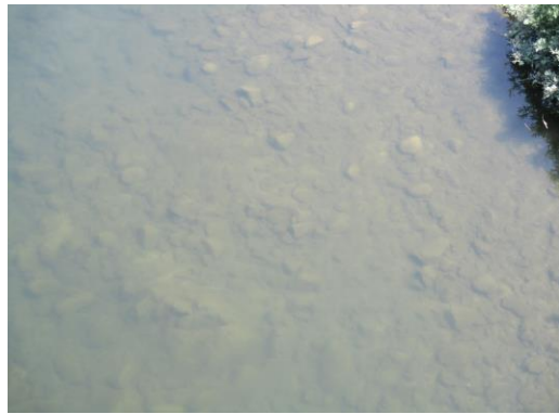
写真14 No.47 地点 矢作川上流 奥矢作橋 (直下左岸寄り河床、下流方向、6/3)