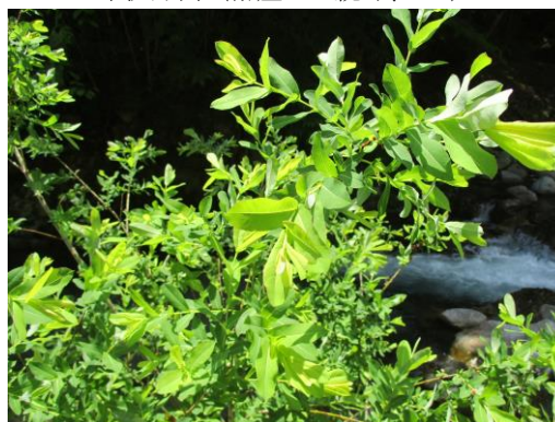
写真 4 No.1 地点 岸沿いに自生するヤナギ(若葉、6/3)