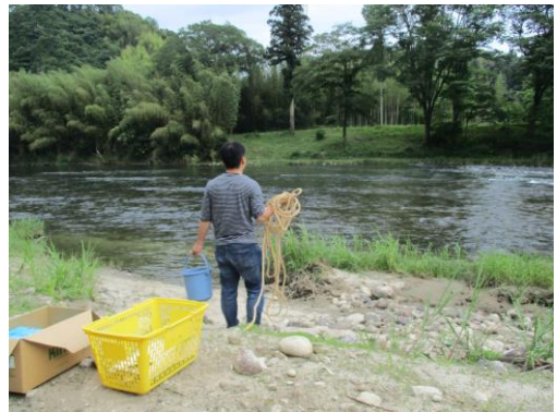
写真 29 No.6' 地点 矢作川 ソジバ (阿摺ダム下流約 700m、6/3)