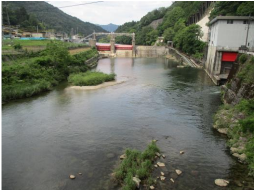
写真 17 No.56 地点 矢作川 岩倉橋 (橋から上流、百月ダム、右は発電所・放流、6/3)