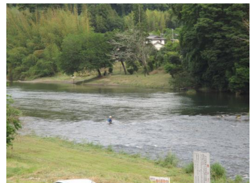
写真 32 No.58 地点、犬伏川 犬伏橋 矢作川上流方向、アユ釣り人、6/3)