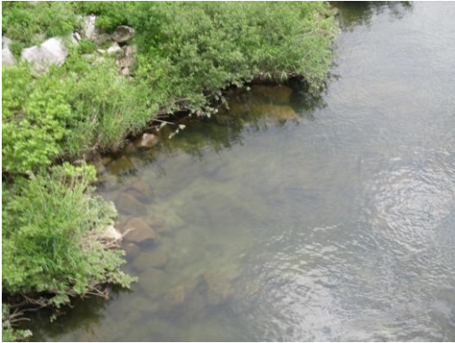
写真 25 No.56 地点 矢作川 岩倉橋 (下流左岸寄り河床、6/3)