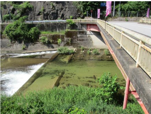
写真15 No.48 地点 明智川 川ヶ渡橋 (左岸から右岸方向・魚道、6/3)