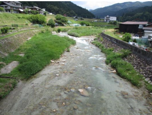
写真 7 No.46 飯田洞川 中広橋 (上流方向、6/3)