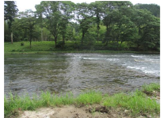
写真 30 No.6' 地点 矢作川 ソジバ (手前が右岸、遠方が左岸、6/3)