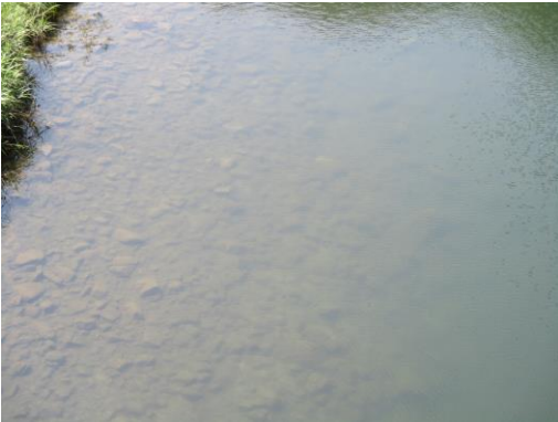
写真13 No.47 地点 矢作川上流 奥矢作橋 (直上左岸寄り河床、上流方向、6/3)