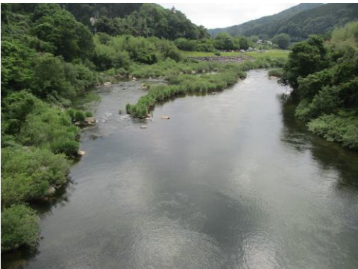
写真 23 No.56 地点 矢作川 岩倉橋 (橋から下流方向、6/3)