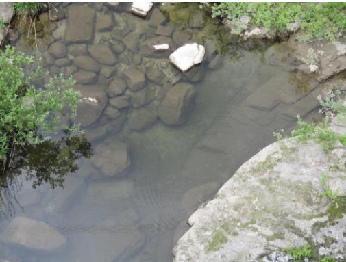
写真 21 No.56 地点 矢作川 岩倉橋 (左岸・橋基部の河床、6/3)