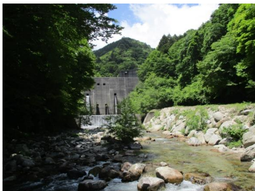
写真 1 No.1 地点 柳川 (平谷川上流) 砂防ダム下「矢作川源流の碑」(左岸付近、6/3)