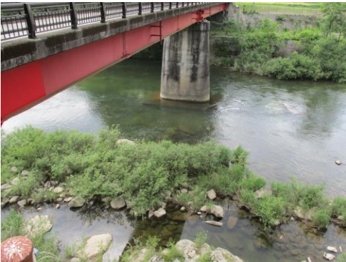
写真 19 No.56 地点 矢作川 岩倉橋 (左岸から橋直下、6/3)