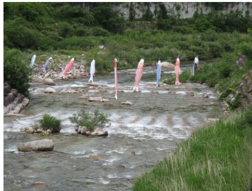
写真 8 No.46 飯田洞川 中広橋 (下流方向、6/3) 上村川合流前、川を横断して鯉のぼりが架かる