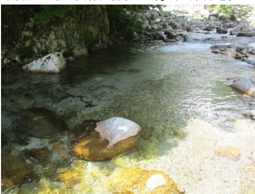
写真 3 No.1 地点 清冽な流水 (浅い淵、6/3)