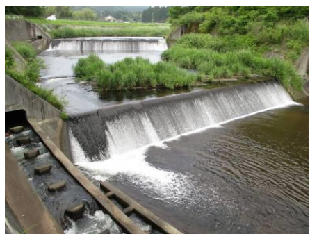
写真 69 No.54 地点 巴川最上流 三河湖上流、菅沼川合流点下 (上流方向)