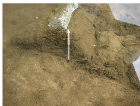
写真 85 No.12 地点 青木川下流 同右上、河床 (泥土沈積、水温測定) (水温 18.0°C、透視度 35cm、COD 4mg/l)