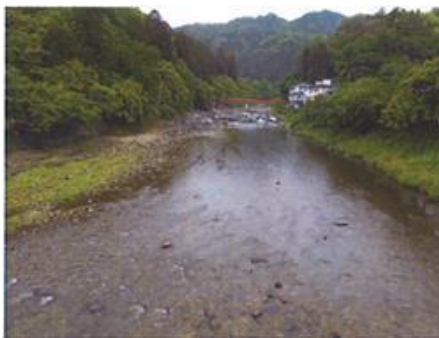
写真 72 No.9 地点 巴川上流 同左、上流側 (南方向)