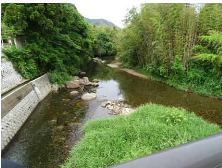
写真 87 No.37 地点 男川上流 豊橋、上流方向