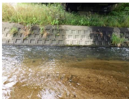
写真 82 No.49 地点 伊保川 同左、橋下 (右岸側) の流況・河床 (砂礫)