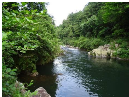
写真 89 No.38 地点 男川中流 夏山川合流点の下流 (右岸から上流方向)