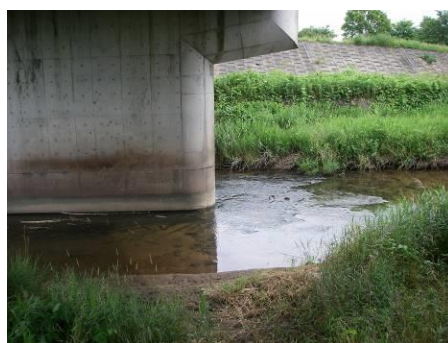
写真 84 No.12 地点 青木川下流 同左、橋梁下 (6/4 晴天時)