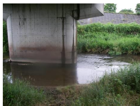
写真 86 No.12 地点 青木川下流 同上、橋梁下 (6/5 雨天時) (透視度 15cm)