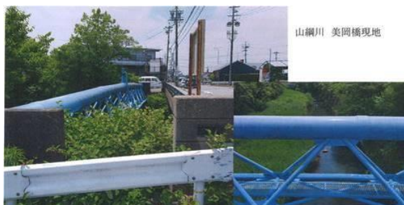
写真 95 No.50 地点 山綱川下流 美岡橋 (上流側)