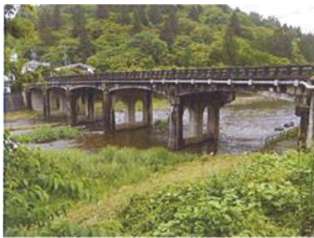
写真 71 No.9 地点 巴川上流 巴橋 (下流側左岸から)