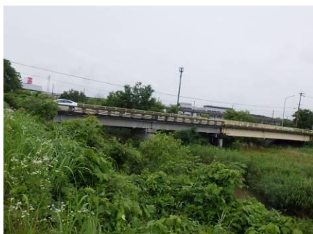
写真 79 No.11 地点 籠川下流 籠川橋（下流側右岸から） （河川敷・河床に樹木・多年草が繁茂する。）