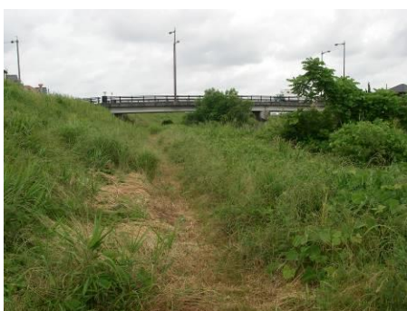
写真 83 No.12 地点 青木川下流 青木橋 (6/4)