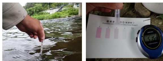
写真 76 No.10 地点 巴川下流 同左、水質測定（水温 17.5℃、COD 4mg/l）