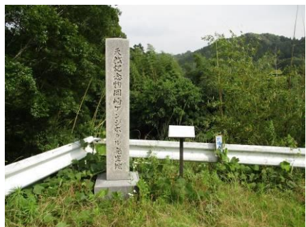
写真 93 No.13・14 地点 (男川・乙川) 石碑: 天然記念物岡崎ゲンジボタル発生地、サイン: 岡崎市都市景観環境賞 乙川を美しくする会 1992