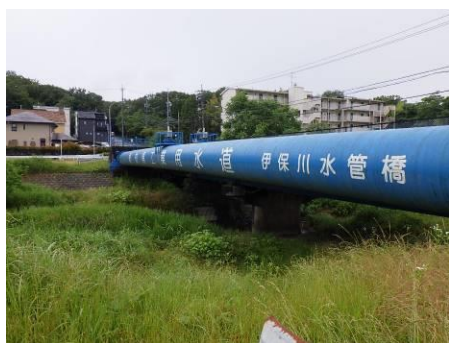
写真 81 No.49 地点 伊保川 向山橋 (下流側左岸から)