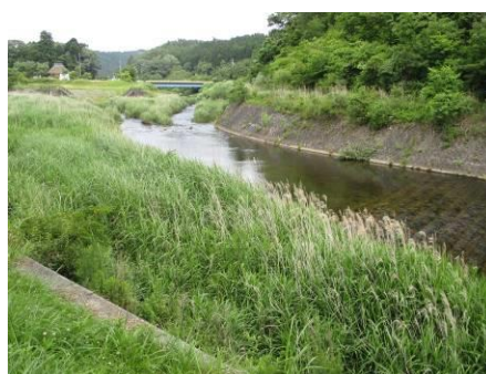
写真 68 巴川最上流 三河湖上流、菅沼川合流点