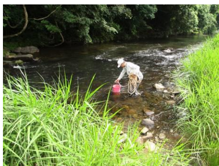
写真 91 No.13 地点 男川下流 学校橋の下流、採水