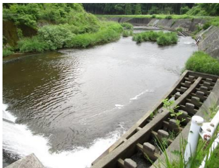
写真 70 No.54 地点 巴川最上流 三河湖上流、菅沼川合流点下 (下流方向)