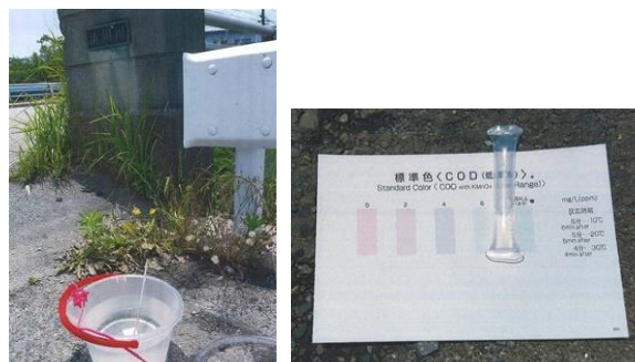
写真 96 No.15 地点 山綱川下流 同左、水質測定 (水温 23.0°C、COD 6mg/l)