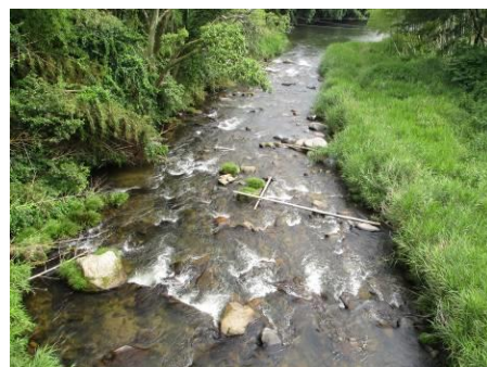
写真 92 No.14 地点 乙川上流 築野橋 (遠方: 左手から男川が合流する)