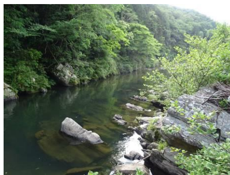
写真 90 No.38 地点 男川中流 同左 (右岸から下流方向)