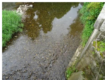
写真 88 No.37 地点 男川上流 同左、河床 (左岸側)