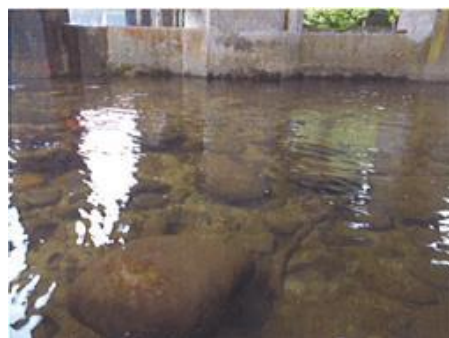
写真 74 No.9 地点 巴川上流 同左、透明な流水、砂礫床