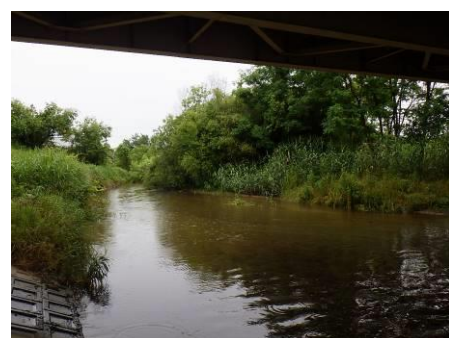
写真 80 No.No.11 地点 籠川下流 同左、橋下右岸側の流況とマウンド化した中洲 （堆砂で嵩上がり樹林形成が進行している。）