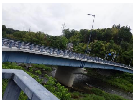
写真 75 No.10 地点 巴川下流 松平橋（右岸）