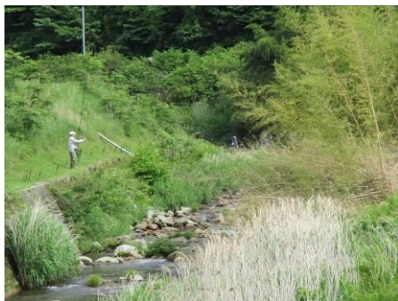
写真 65 No.55 地点 No.31 地点 段戸川上流 大橋の上流 遊漁者