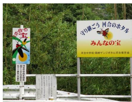
写真 94 No.13・14 地点 (男川・乙川) 環境保全活動サイン: 河合中学校生徒会・岡崎ゲンジボタル河合保存会・生平小・秦梨小児童会、漁協告知板