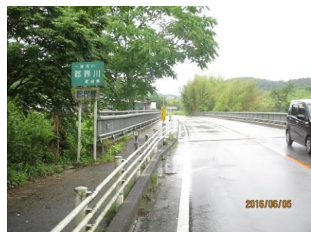
写真 77 No.33 地点 郡界川下流 郡界橋