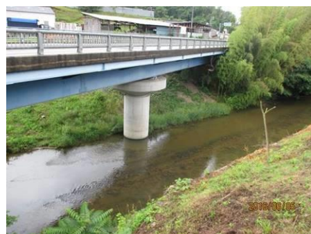
写真 78 No.33 地点 郡界川下流 郡界橋（巴川との合流前）