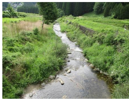
写真 66 No.31 地点 段戸川上流 大橋、下流側